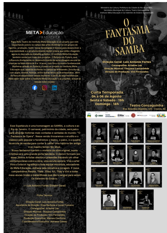
Cartaz (à cima) e programa (à direita) da peça “O fantasma do Samba”, atualizados para a temporada 2023