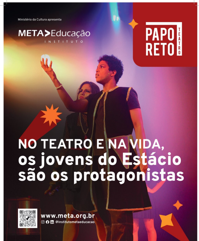
Banners do projeto expostos em nossa sede