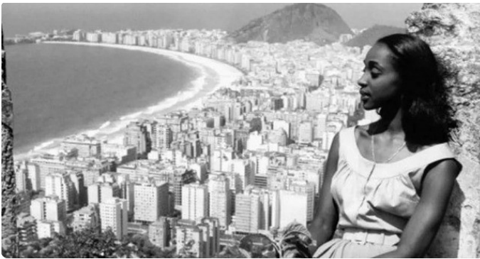
Léa Garcia, atriz homenageada, em uma cena do filme

Em homenagem à atriz Léa Garcia, que faleceu em agosto aos 90 anos. Foi exibido para a turma o filme Orfeu Negro, de 1959, com uma sessão de debate em seguida. Luiz, aluno novo do projeto, disse: “me vi no filme, a favela estava linda e gostei muito de ver isso”. Essa obra e outras, discutidas em sala, serviram de inspiração para a criação da nova peça.