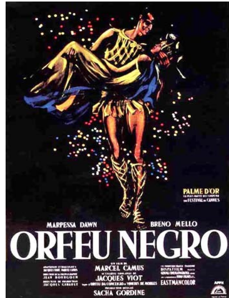
Cartaz do filme “Orfeu Negro”