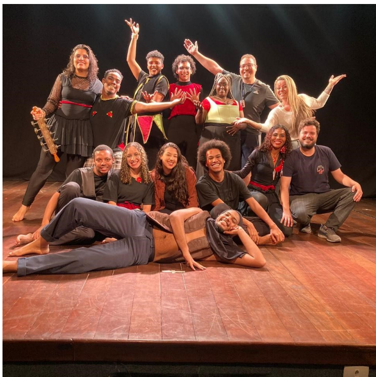
Elenco e equipe de “O fantasma no samba” , agosto de 2023

A última exibição da peça em 2023 foi na sede do Operador Nacional do Sistema Elétrico (ONS) no dia 29 de agosto. A empresa, que é parceira do Instituto, nos convidou para compor a comemoração de seus 50 anos. Além de funcionários da ONS outras empresas da Cidade Nova tiveram representantes presentes, como a CEDAE. Os jovens foram muito bem recebidos e nos foi oferecido um sistema de iluminação exclusivo para a peça e almoço para todos os atores e equipe. A resposta dos funcionários foi incrível, muitos riam, se emocionavam e algumas pessoas que falaram que estavam com pouco tempo disponível acabaram vendo a peça até o final.