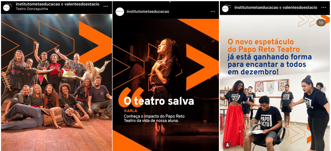
Posts do Papo Reto no Instagram no Instituto, @institutometaeducacao