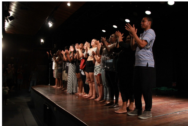
Cenas da peça “Um Lugar Chamado Esperança”, 14/12/23 no Teatro Gonzaguinha, no Centro de Artes Calouste Gulbenkian