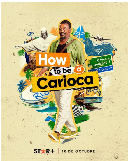
Cartaz da série “How to be a Carioca”