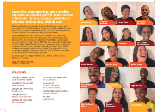
Cartaz (à esquerda) e programa (à direita) da peça “Um Lugar Chamado Esperança”