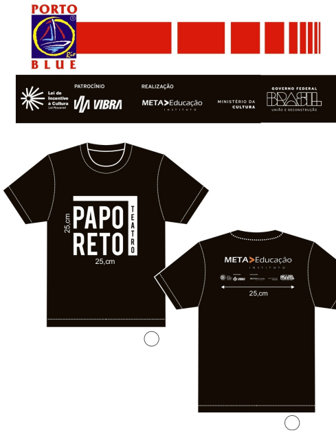
Camisa do ano letivo, uniforme

O Instituto Meta Educação investiu em peças de divulgação tanto para as apresentações teatrais, quanto para enfeitar a nova sede e também para que os participantes se sintam mais pertencentes ao projeto.