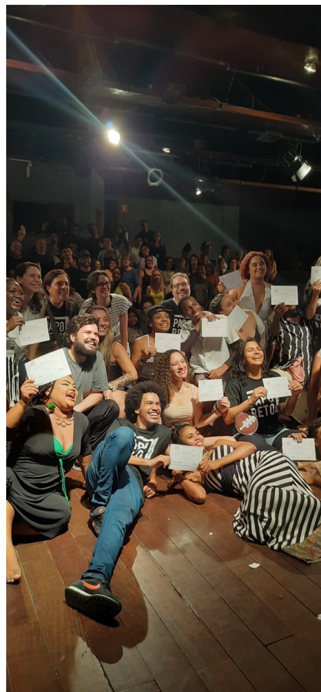
Entrega dos certificados

DOS JOVENS ENGAJADOS E COM BOM DESEMPENHO