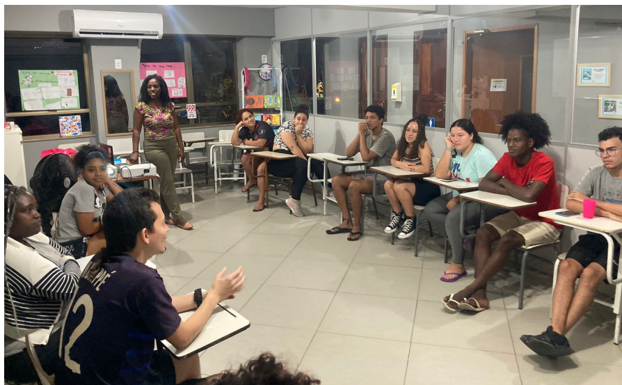
Roda de conversa

Foram divulgados passeios culturais gratuitos para ampliação do repertório cultural dos jovens.